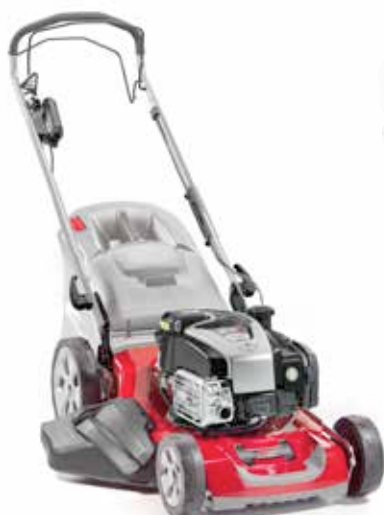
XS 55 BVWE4 [294557523/C16]