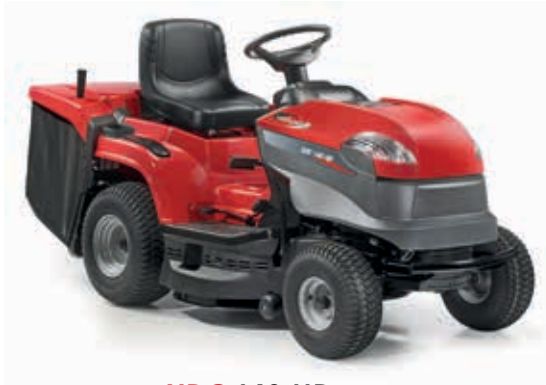
XDC 140 HD [2T2110273/12]