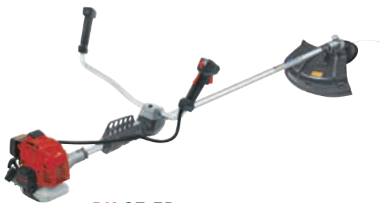
BK 27 ED [288121003/14]