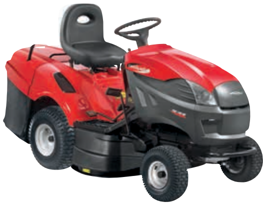
PGX 140 HD [2T0420273/Y13]