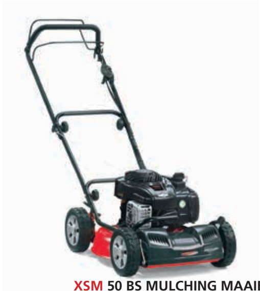
XSM 50 BS MULCHING MAAIER [291502023/C13]