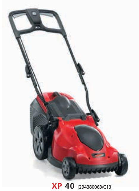
XP 40 [294380063/C13]