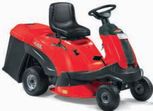
XF 140 HD [2T0220273/13]