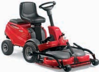
XM 160 HD [2F2720513/C16]

Alle XK machines worden standaard geleverd zonder maaidek. Mogelijke maaibreedten zijn 95 cm en 105 cm.