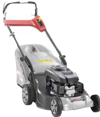
XA 53 HV (3 SPEED) [292148838/C16]