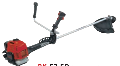
BK 53 ED [288421003/14]