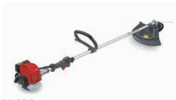
BK 27 E [288120003/14]