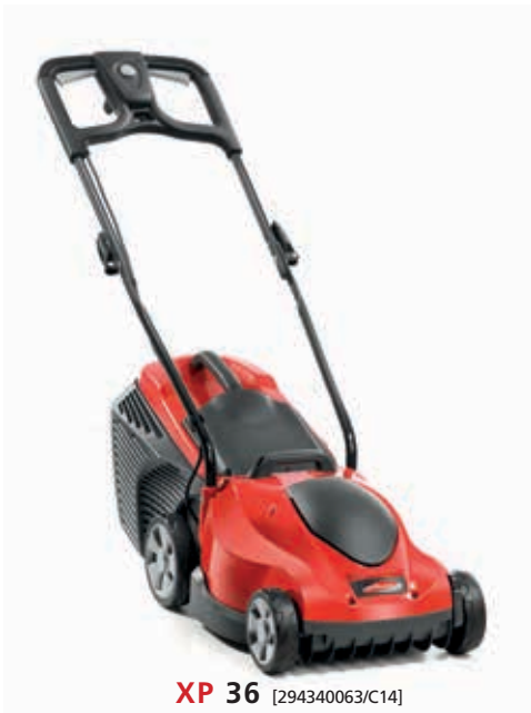
XP 36 [294340063/C14]