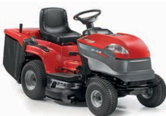
XDC 170HD [2T2620273/C16]