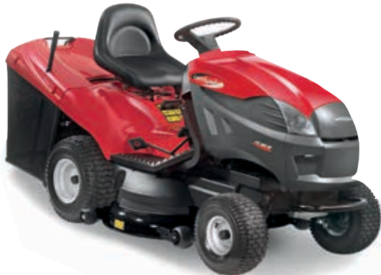
PTX 200 HD [2T0950273/Y13]