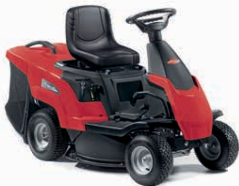
XE 966 HDB [2T0070273/13]