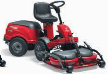
XK 140 HD [2F6220323/C16]