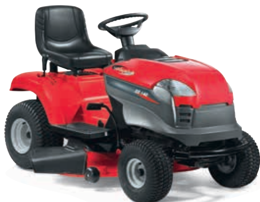
XD 140 [2T0520273/11]