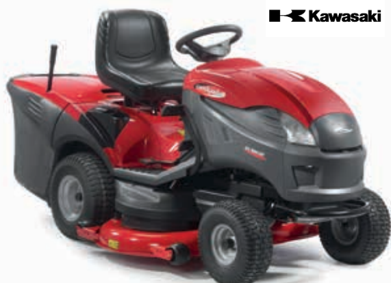
XX 220 HD [2T1320673/C16]