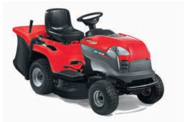
XDC 135 HD [2T2000373/12]