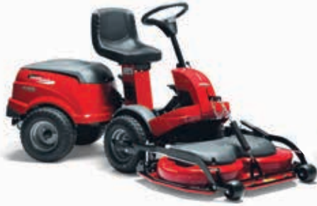
XK4 160 HD [2F6230513/C16]