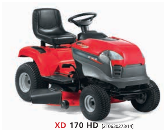
XD 170 HD [2T0630273/14]