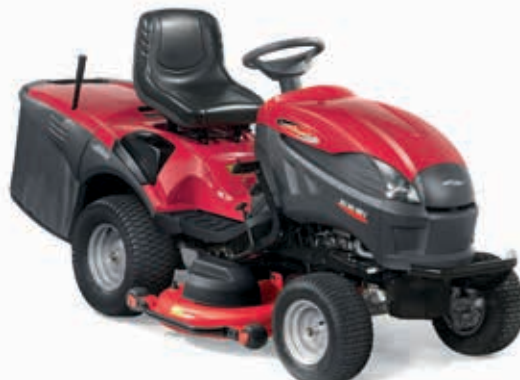
XHX 240 4WD E (EL DUMP) [2T1525273/12]