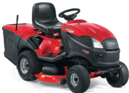
XT 190 HD [2T0950273/11]