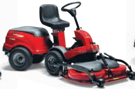
XK 160 HD [2F6220513/C16]