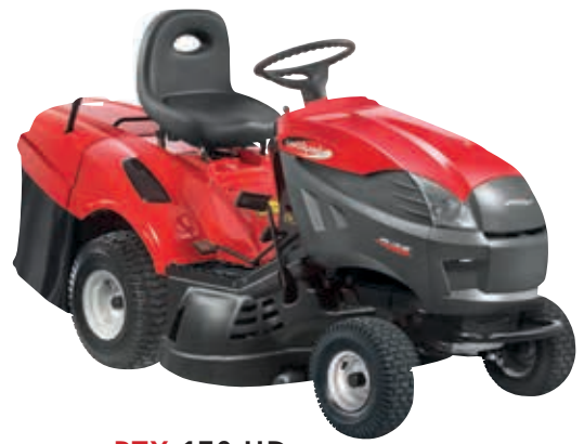
PTX 170 HD [2T1730273/Y13]