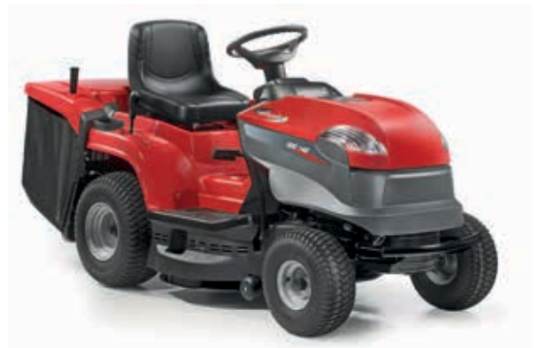
XDC 140 G [2T2010473/15]