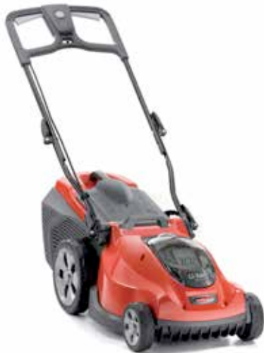
XP 40 LI BATTERIJMAAIER [294385063/C16]